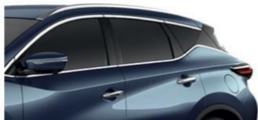
Темно-синий — RBG