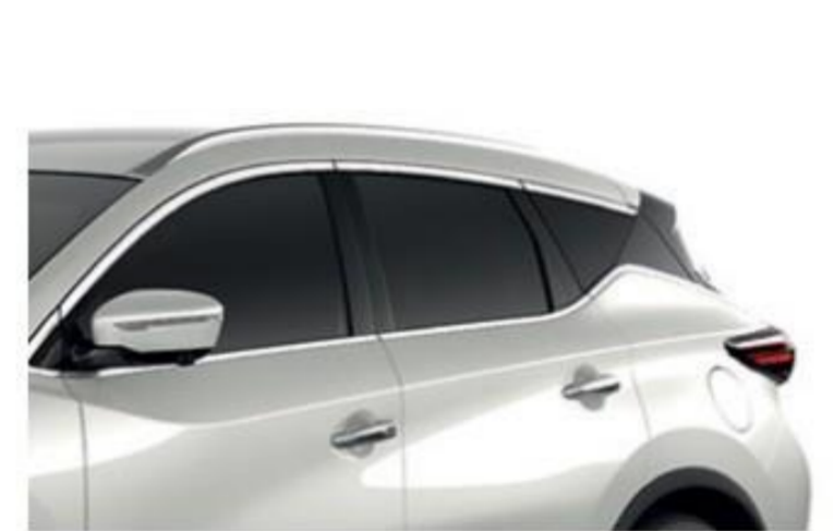
Белый перламутр — QAB