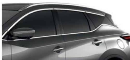
Темно-серый — KAD