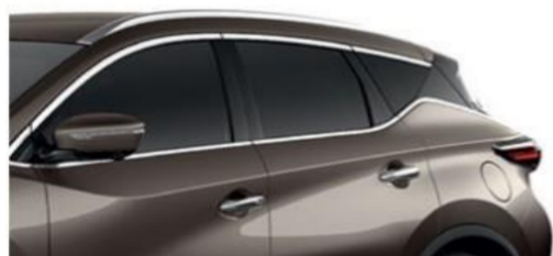
Серо-коричневый — CAM