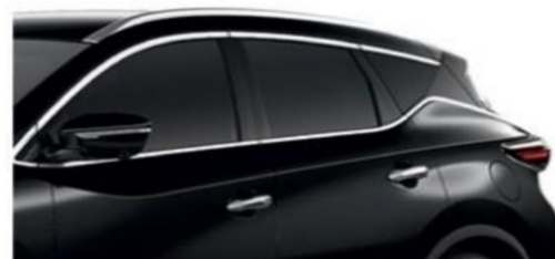
Черный — G41