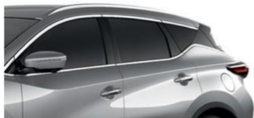
Серебристый — K23