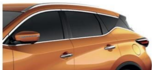
Оранжевый — EAW